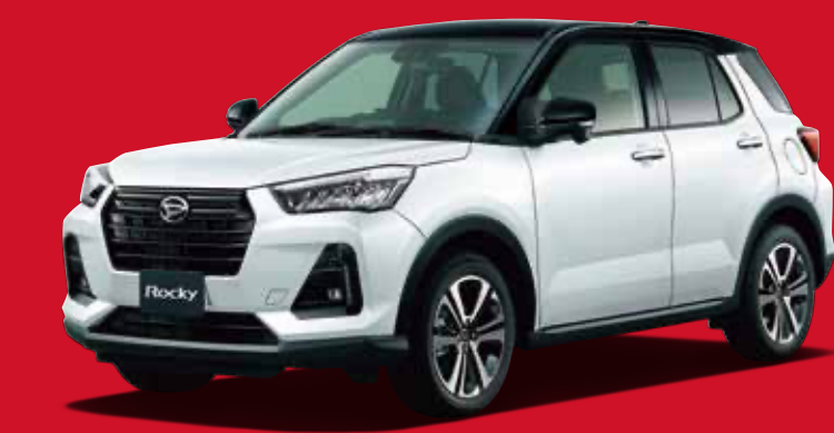
Photo:ロッキー G (ボディーカラーのブラックマイカM(X07) ×シャイニングホワイトパール(W25) [XH3])はメーカーオプションで77,000円高(税込)(消費税込70,000円)

期間 2021年4月1日(木)～2021年6月30日(水)まで 対象車種 ロッキー G・ロッキー Premium