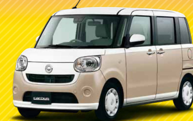
Photo:ムーヴキャンバス G SAIII (ボディーカラーのパールホワイトIII(W24)×グロリアルベージュイカM(T92)) [XE9]はメーカーオプションで66,000円高(消費税込60,000円)

期間 2021年4月1日(木)～2021年6月30日(水)まで 対象車種 ムーヴキャンバス ワンプライス車のみ (2WD車が対象)