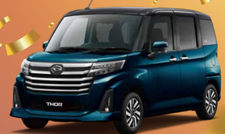
Photo:トールカスタムG 2WD (ボディーカラーのブラックマイカM(X07)×レーザーブルークリスタルシャイン(B82) [XG3])はメーカーオプションで77,000円高(消費税込70,000円)

期間 2021年4月1日(木)～2021年6月30日(水)まで 対象車種 トールG・トールGターボ・トールカスタムG・トールカスタムGターボ の2WD車のみ