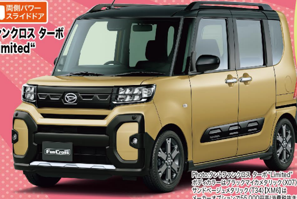
Photo:タントファンクロスターボ "Limited" ボディカラーは サトウ色メタリック(X07)× サトウ色メタリック(T34)(XMG)は メーカーオプションで55,000円高(消費税抜き50,000円)